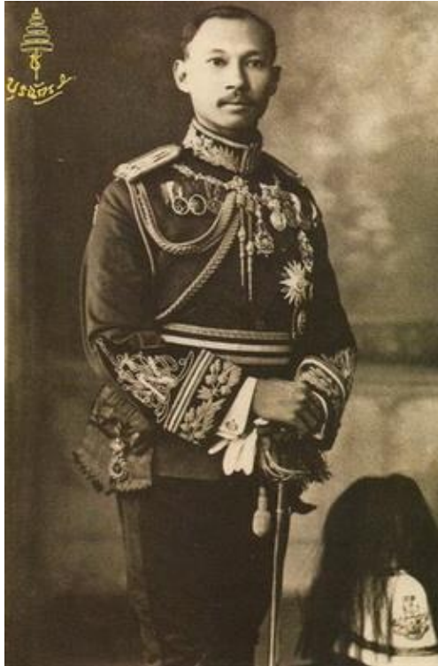
พลเอกพระเจ้าบรมวงศ์เธอกรมพระกำแพงเพชรอัครโยธิน นายกก่อตั้งสโมสรโรตารีกรุงเทพ สโมสรโรตารีแห่งแรกในประเทศไทย Commissioner – General His Royal Highness Prince Purachatra Jayakara, Prince of Kambaengbejra Charter President of Rotary Club of Bangkok, The First Rotary Club in Thailand.