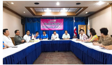
ประชุมบอร์ด