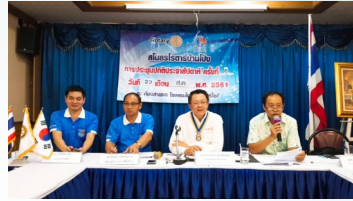
ประชุมปกติประจำสัปดาห์