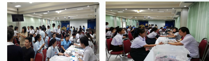
รับบริจาคโลหิต เพื่อถวายเป็นพระราชกุศล แด่สมเด็จพระนางเจ้าพระบรมราชินีนาถ ในรัชกาลที่ 9