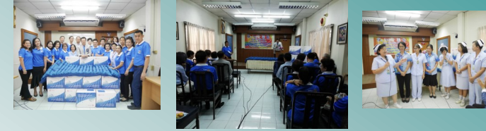
มอบที่นอนลม เพื่อป้องกันแผลกดทับ ให้กับโรงพยาบาลบ้านโป่ง