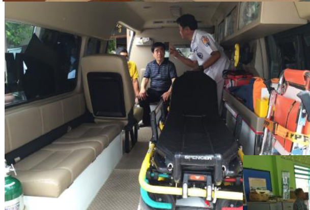
สโมสรโรตารี ราชบุรี ดónรับ นายกรพร้อมโรแทเรียนจากสโมสรโรตารี อินซอน จูอัน ประเทศเกาหลีได้ มาร่วมพิธีสถาปนานายกและคณะกรรมการ บริหารสโมสรโรตารีราชบุรี พร้อมเยี่ยมชมมูลนิธิประชาชนกุล อ.เมืองจ.ราชบุรี และโรงเรียนวัดโลกทอง อ.โพธาราม จ.ราชบุรี