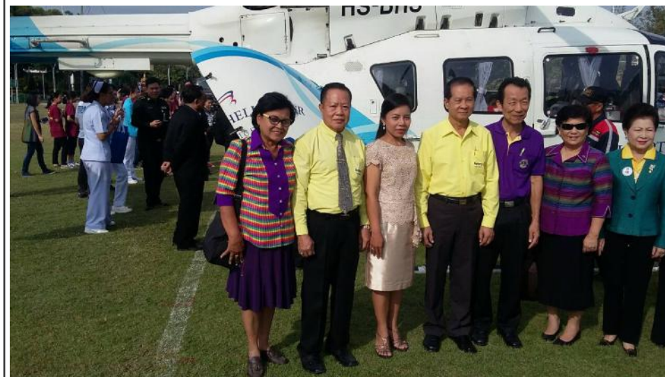
สโมสรโรตารีราชบุรีไปร่วมการซ้อมการเคลื่อนย้ายผู้ป่วยทางอากาศยาน โดยเฮลิคอปเตอร์ ของโรงพยาบาลเมืองราชบุรี เมื่อวันที่ 24 ธันวาคม 2558 ณ สนามกีฬากรมการทหารช่าง ค่ายภานุรังษี อ.เมืองราชบุรี