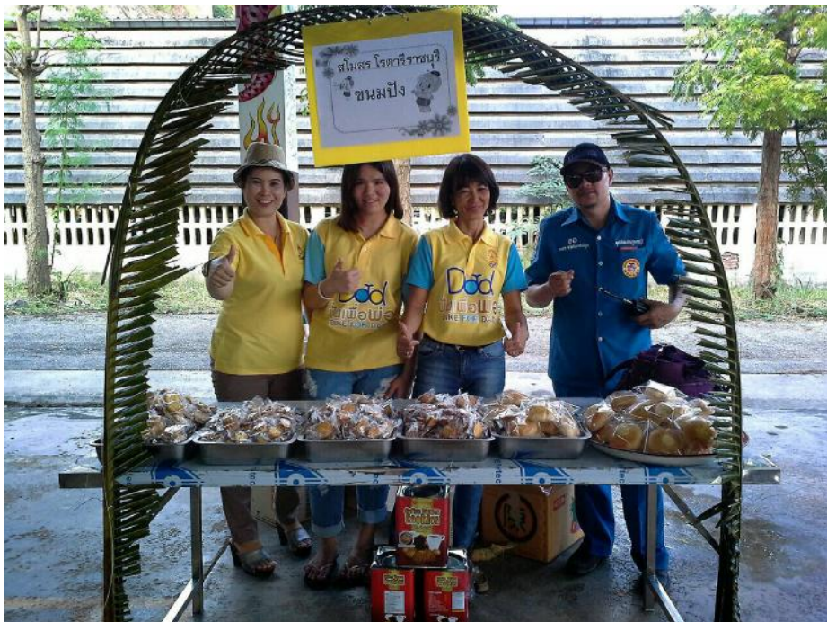
สโมสรโรตารีราชบุรีร่วมสนับสนุนการปั่นจักรยาน “BIKE FOR DAD” โดยนำขนมปังนำไปแจกให้แก่ผู้ปั่นจักรยาน เมื่อวันที่ 11 ธันวาคม 2558 ณ บริเวณลานอุทยาน ร.1 จ.ราชบุรี