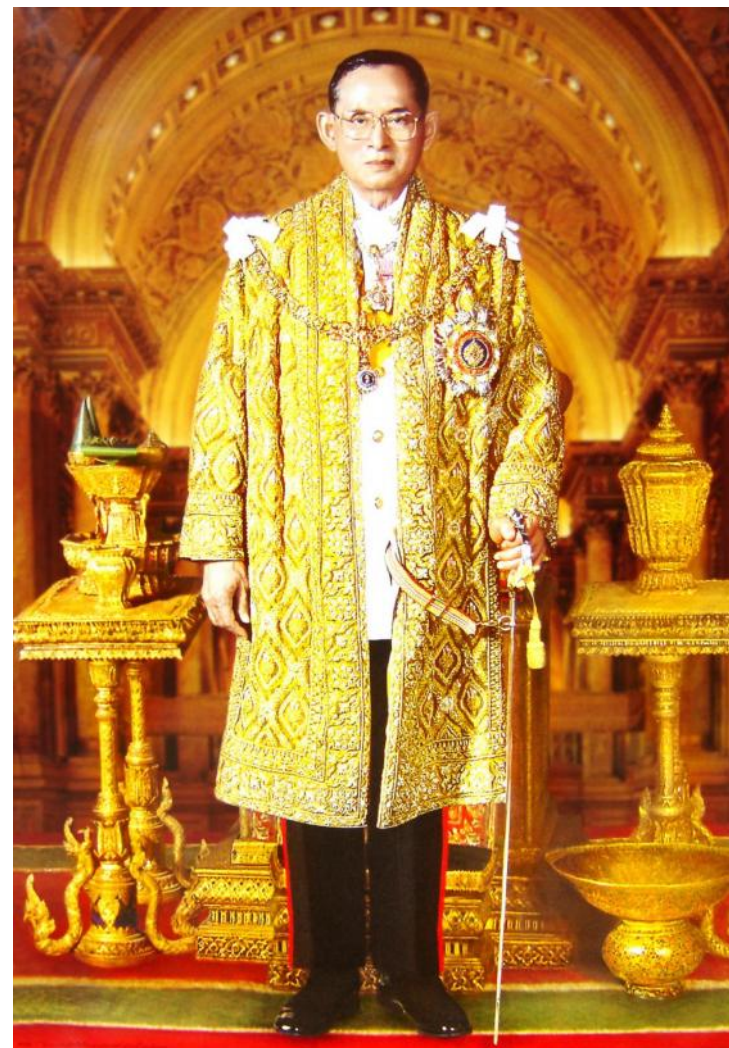
ที่มายุโกโหตุ มหาราชา ขอพระองค์ทรงพระเจริญยิ่งยืนนาน

ด้วยเกล้าด้วยกระหม่อม ขอเดชะ ข้าพระพุทธเจ้า สมาชิกสโมสรโรตารีราชบุรี