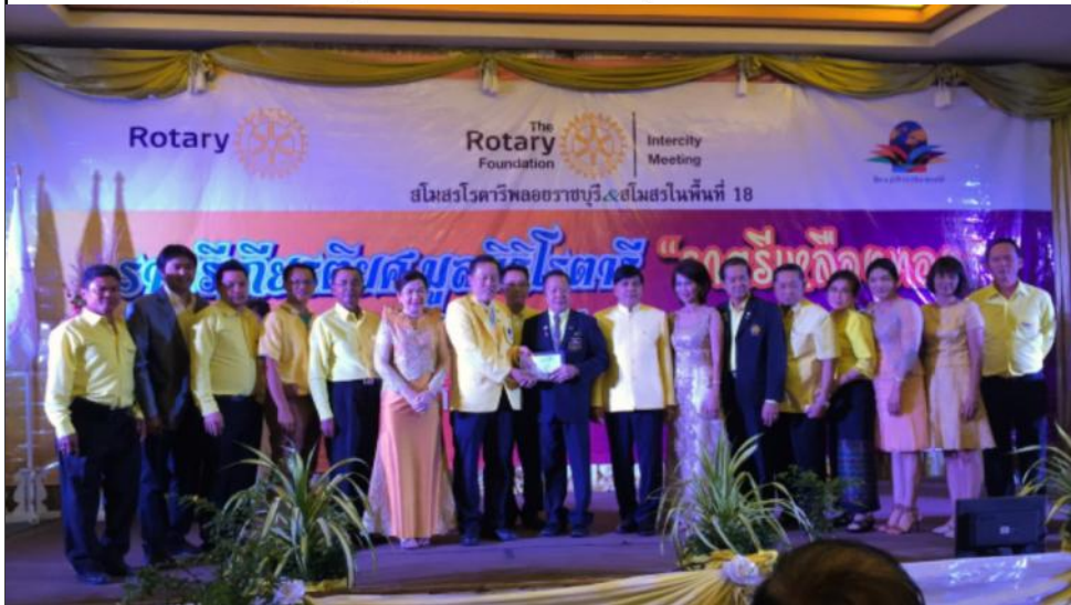
สโมสรโรตารีราชบุรีเข้าร่วมประชุมระหว่างเมือง ครั้งที่ 3 วันที่ 12 ธันวาคม 2558 ณ โรงแรมโกลเด้นซิตี อ.เมืองราชบุรี