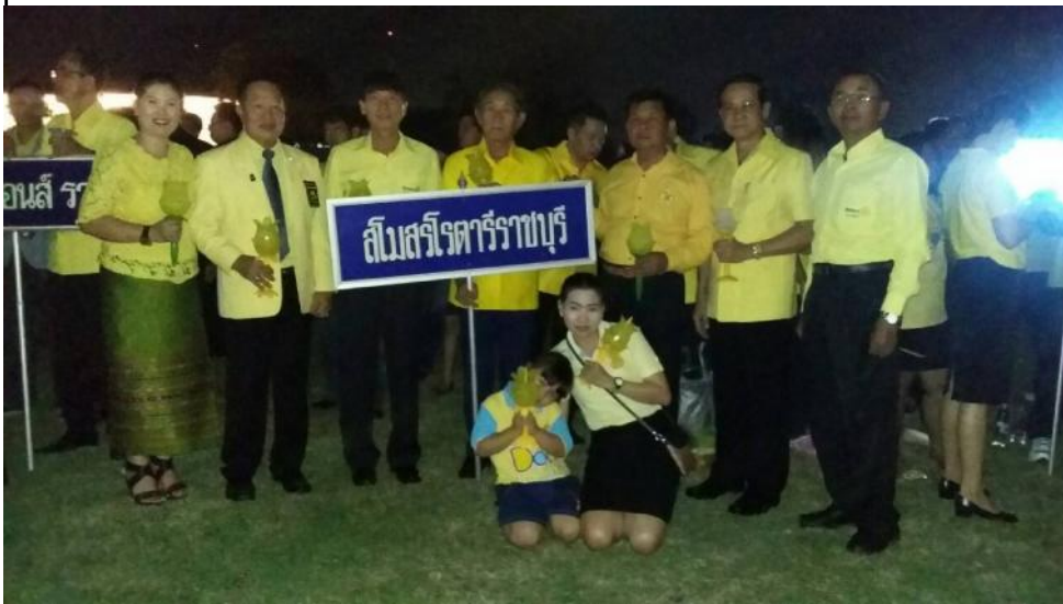
ร่วมจุดเทียนชัยถวายพระพรชัยมงคล เนื่องในพ่อแห่งชาติ วันที่ 5 ธันวาคม 2558 ณ สนามกีฬากองทัพบก ค่ายกาญจนาภิเษย ส่วนที่ 1 อ.เมืองราชบุรี