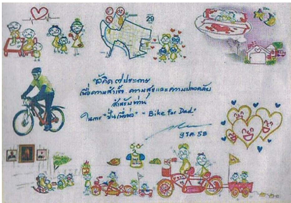
สมเด็จพระบรมโอรสาธิราชฯ สยามมกุฎราชกุมาร พระราชทานภาพฝีพระหัตถ์และข้อห่วงใย 7 ข้อ ในการปั่นจักรยาน “ปั่นเพื่อพ่อ BIKE FOR DAD” ให้แก่คณะกรรมการฝ่ายประชาสัมพันธ์ การจัดงานนำเผยแพร่ผ่านเว็บไซต์ www.bikefordad2015.com เพื่อให้ประชาชนได้นำไปปฏิบัติ